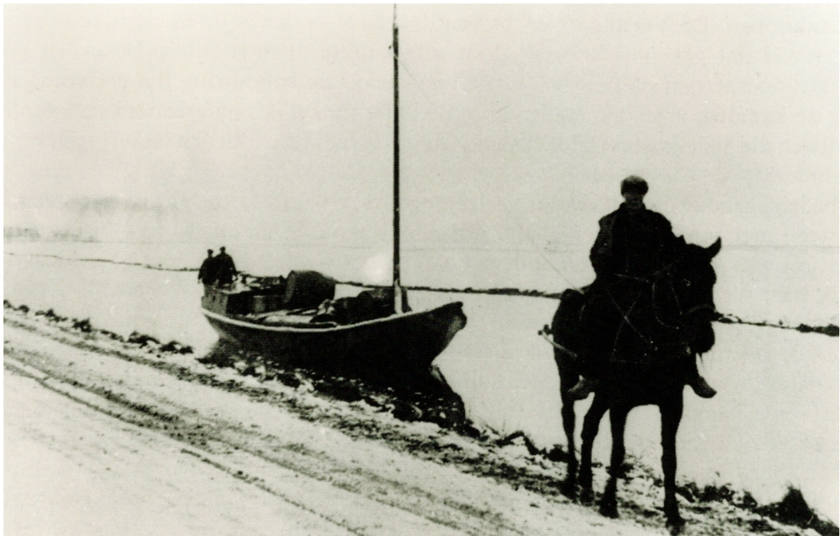
De trekschuit (snik) van Hoogezand naar Groningen, varend in het Kieldiep. De snik werd gebruikt voor zowel personen- als goederenvervoer. Op het 'snikpeerd' zit het 'snikjong'.

De negen artikelen van dit reglement geef ik hieronder in extenso weer.