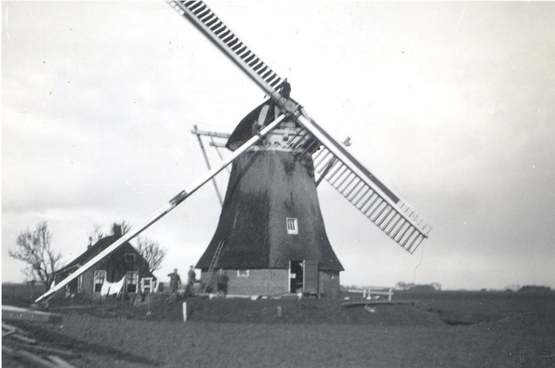
Stedum (Gr) 'Barnheemster molen', gebouwd 1868, afgebroken in 1958.