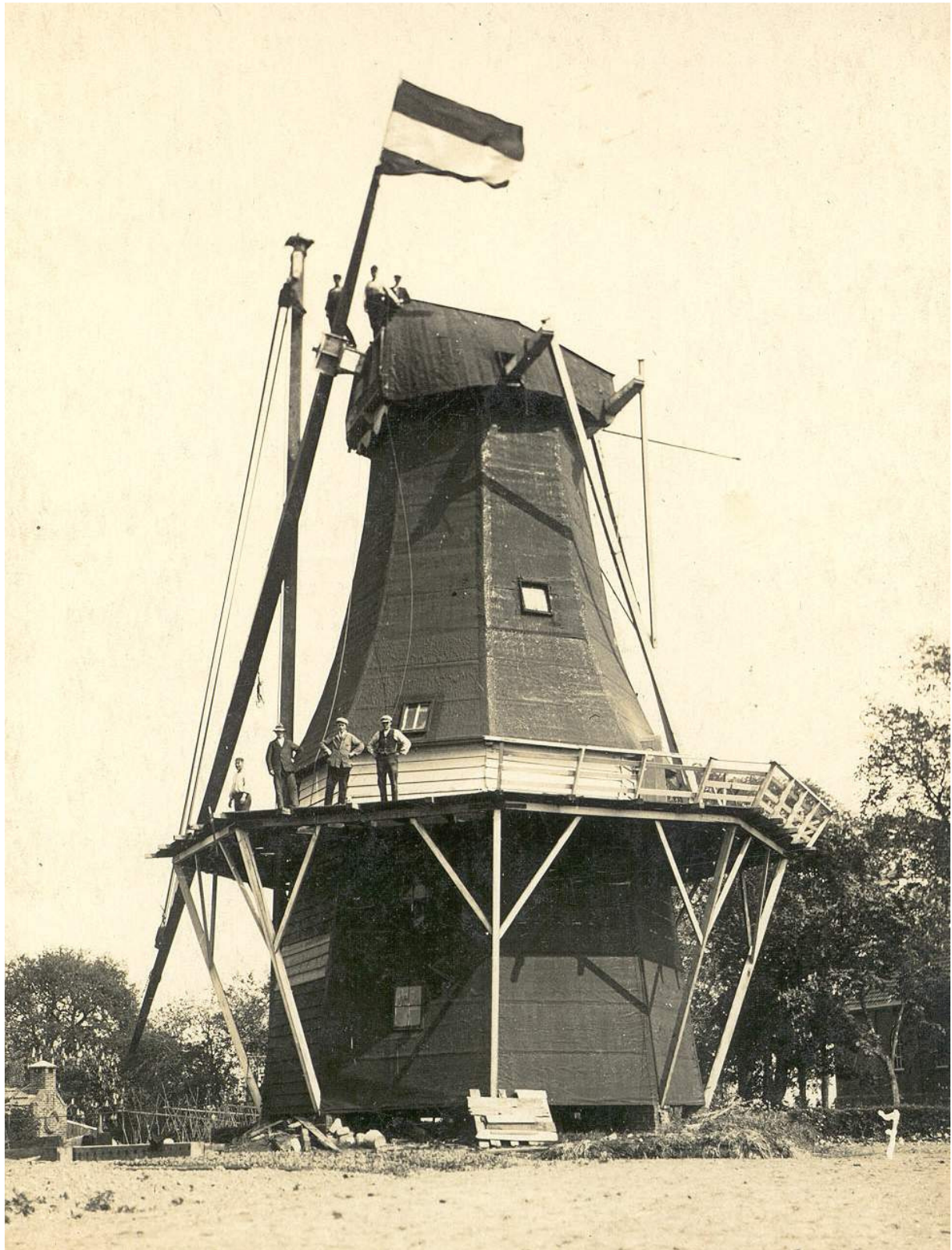
Eppenhuisen (Gr) koren- en pelmolen 'Hoop op behoud'. Molenbouwer Hut stak in 1931 de roeden. Gebouwd in 1858, afgebroken in 1955.