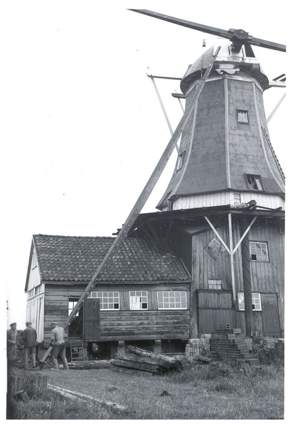
Woltersum (Gr) houtzaagmolen 'Fram' - roedesteken 8 juli 1960.