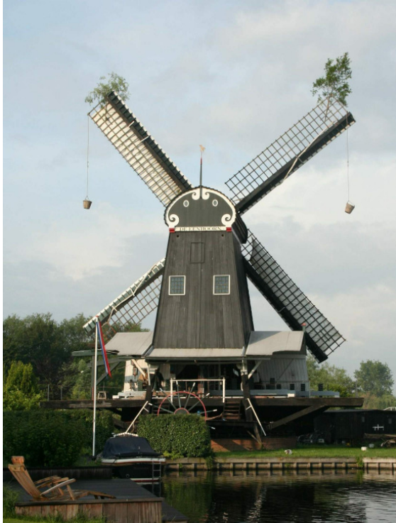
De paltrok 'De Eenhoorn' te Haarlem in Pinkstertooi.

In 2007 verscheen ter gelegenheid van het 'Jaar van de molens' het boek 'Molens, de nieuwe Stokhuyzen'. Hierin wordt op pagina 195-196 eveneens aandacht besteed aan het luilakvieren en de Pinkstertooi, alsmede dat men in de Achterhoek, Noord-Brabant en Limburg ter completering van de feesttooi gebruik maakte van dennentakken of ander groen in de wieken. De laatste zin hierover luidt: