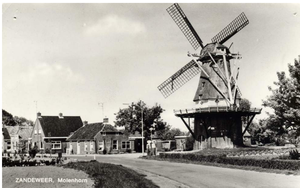
Koren- en pelmolen Windlust te Zandeweer. In 1818 als grondzeiler gebouwd en in 1886 verhoogd. (foto 1972, collectie P. van Dijken)

Het achtkant valt mee, alleen beide westelijke achtkantstijlen worden van onderen aangetast en één stel nieuwe kruisen. In de zomer van 1975 worden kap en achtkant voorzien van nieuw riet door de fa. Kleinjan te Den Ham (Ov). Na deze werkzaamheden worden de kap en staartwerk alsmede de oude nog bruikbare roeden weer herplaatst, waarna het binnenwerk wordt aangepakt. Vernieuwd worden hier de kap-, steen- en pelzoldervloer en de ombouw van het koppel maalstenen. De muren van het onderachtkant worden nieuw gestucadoord. De oplevering vindt plaats op 17 maart 1976. Kosten incl. verf- en teerwerk ca. fl 130.000,-.