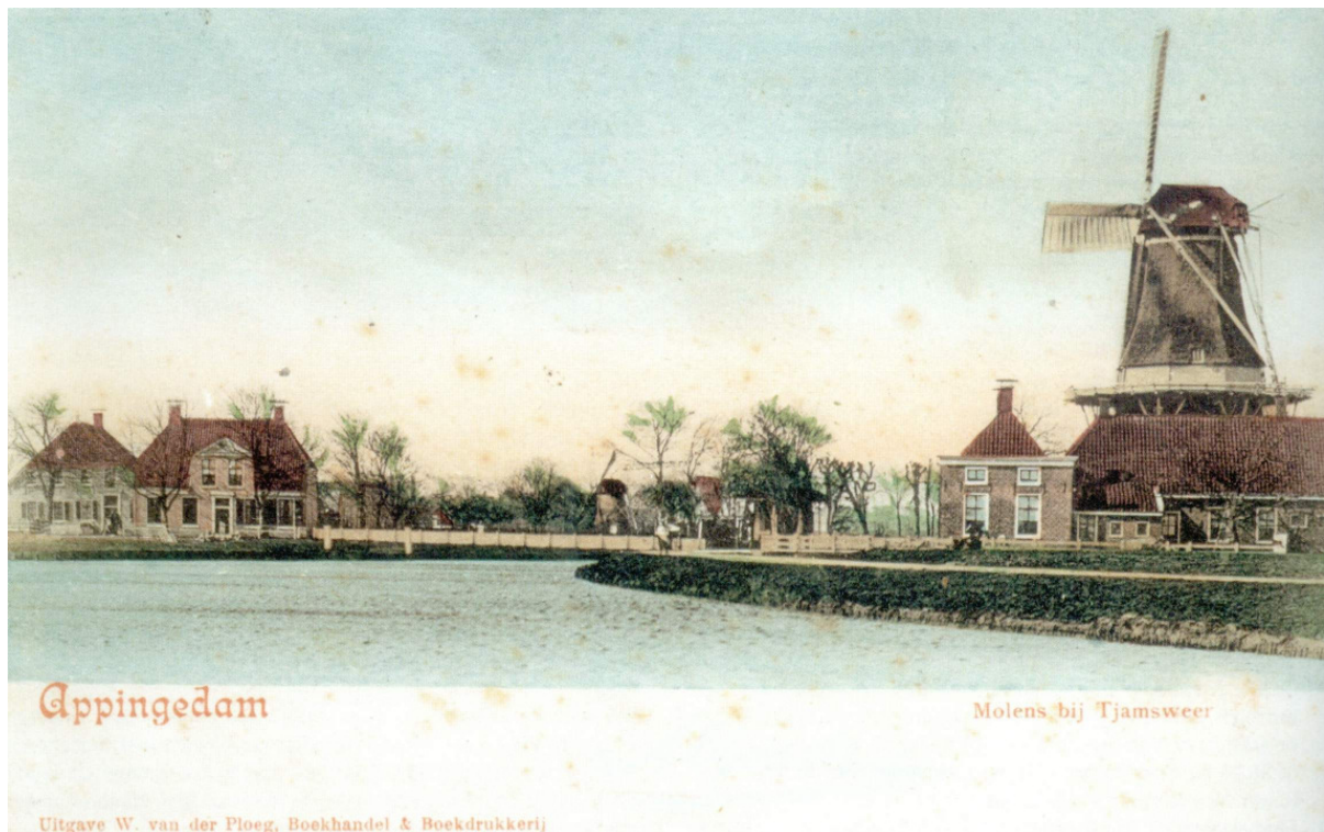
De pelmolen aan het Trekpad te Tjamsweer, in het midden is de watermolen "Veldmansmeulntje" te zien, opname ± 1905.