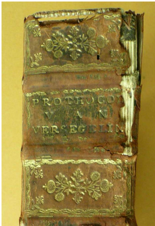
Het bovenste gedeelte van de rug van het boek met de "Prothocollatie van Versegelingen" over de jaren 1779-1787.

Enige interessante bronnen betreffende deze molens bevinden zich in het RHC Groninger Archieven te Groningen. Hier wordt het archief van het gerecht van Appingedam bewaard, waarin zich vele banden met "Protocollatie" 2 , de minuten van de akten bevinden.