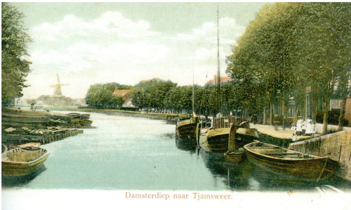
Damsterdiep naar Tjamsweer.

Gedaan in Appingedam den 7 December 1780. Geregistreert den 11 December 1780. (was geteekent) Arent Tonkens, Borgemeester. Coll. accord. H. Alstorpius, Secret.