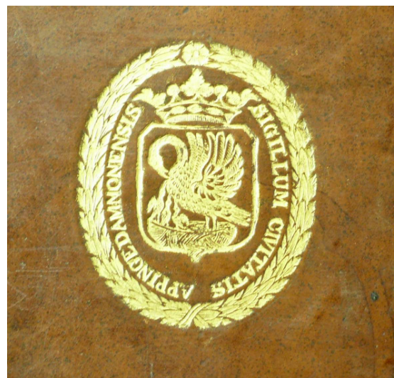
Het wapen van de stad Appingedam geprägd op de boekband.