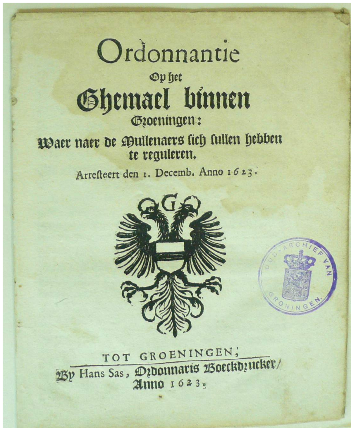
De titelpagina van de gedrukte versie van de ordonnantie op het gemaal van de stad Groningen van 1 december 1623.