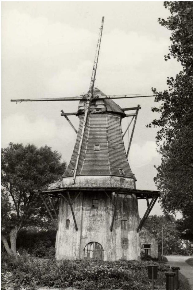
De molen van Wetsinge, gefotografeerd in 1981 en nu nog verder vervallen . . .

Het is een achtkante bovenkruier met stelling. De kap heeft geel-geverfde verticale gepotdekselde planken bekleding. Het achtkant is horizontaal gepotdekseld en grijs geverfd. met witte biezen op de hoeken.