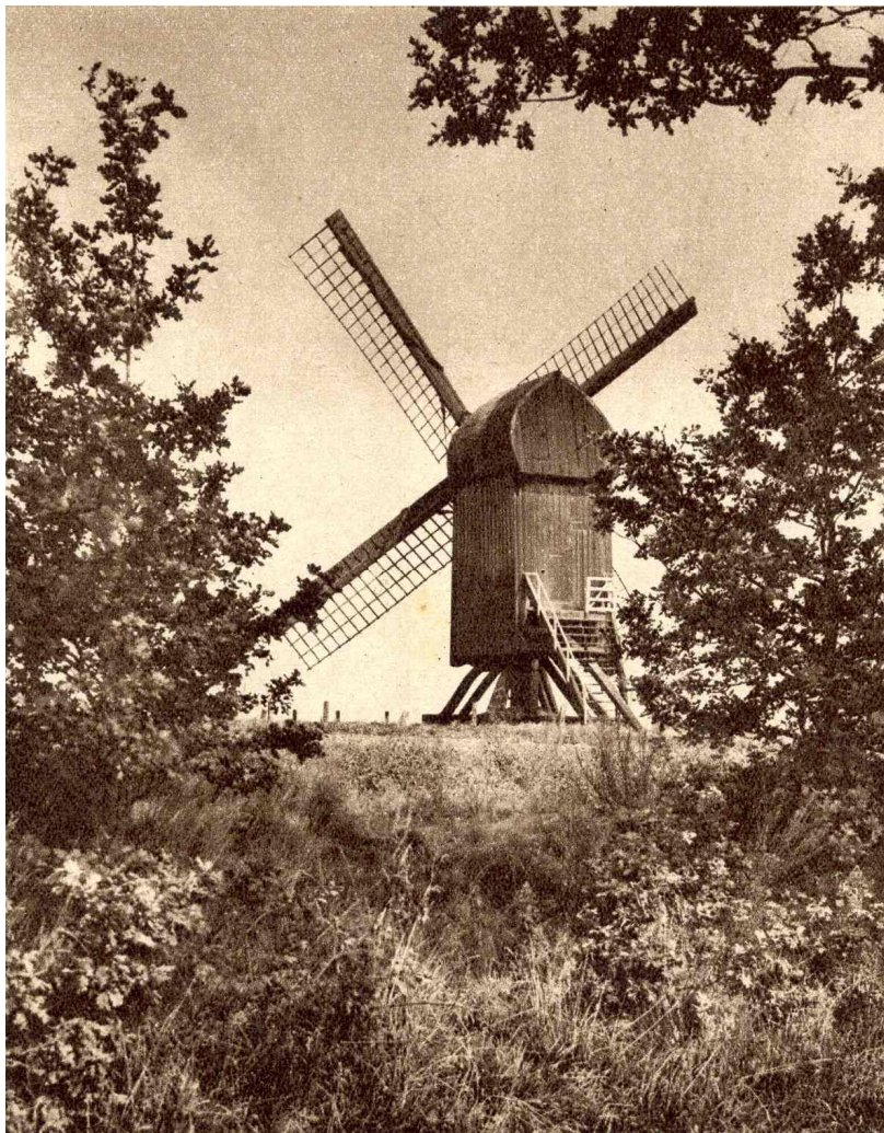
opname 1936