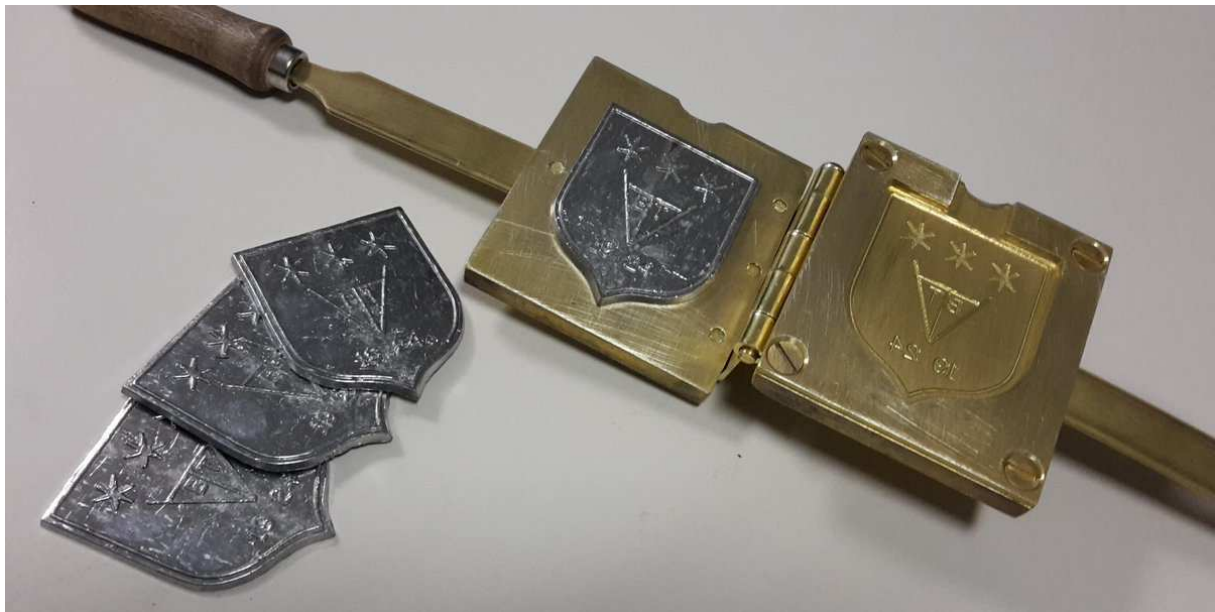
Een trotseerloodjestang van Lood.nu - AGS Products BV waarmee loodjes worden gegoten.

Trotseerloodjes komen ook voor op zijkanten van dakkapellen en op vele plaatsen waar lood of zink met spijkers vastgezet werd.