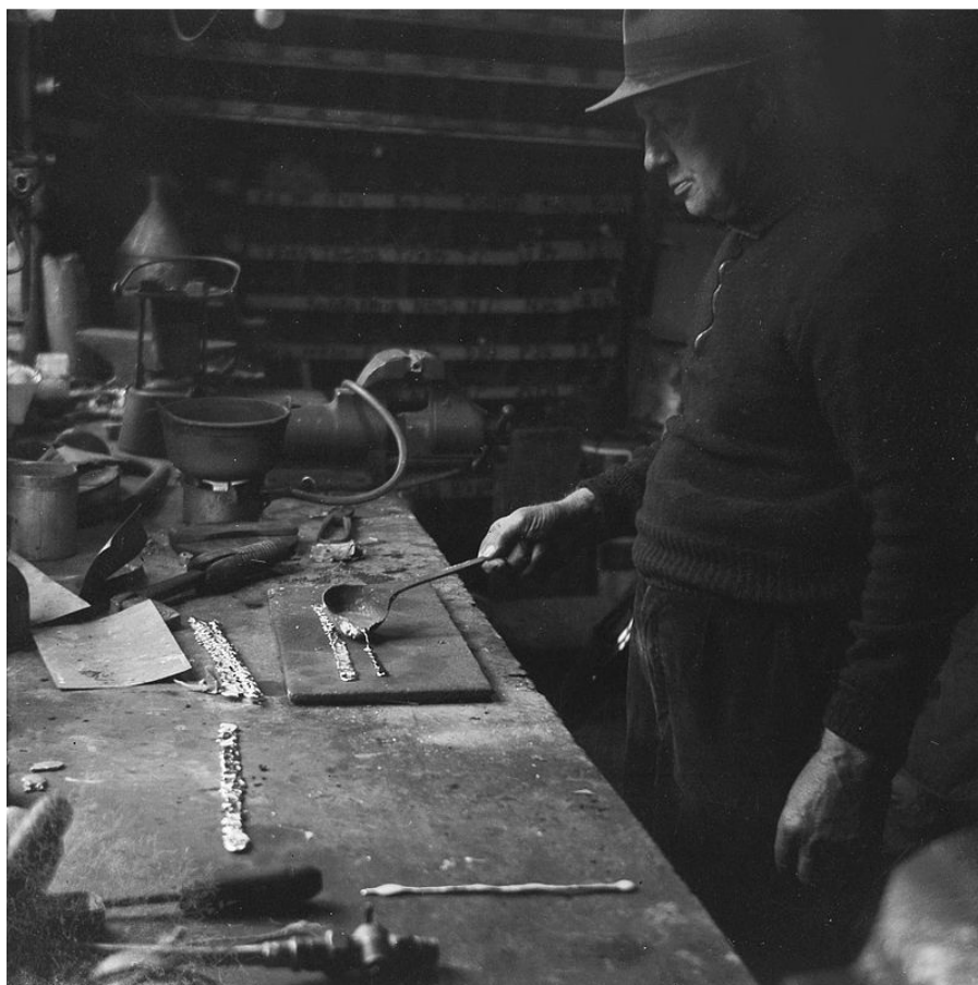
Afbeelding van een loodgieter die bezig is met het gieten van lood.

Een aantal trotseerloodjes uit mijn verzameling zijn afkomstig van de Groninger loodgietersfamilie Loor, die in de 19 e eeuw actief waren in de stad Groningen. Het bedrijf was gevestigd in de Oosterstraat en omvatte tevens een winkel. De familie oefende niet alleen het beroep van loodgieter uit, maar waren ook leidekkers en zinkwerkers.