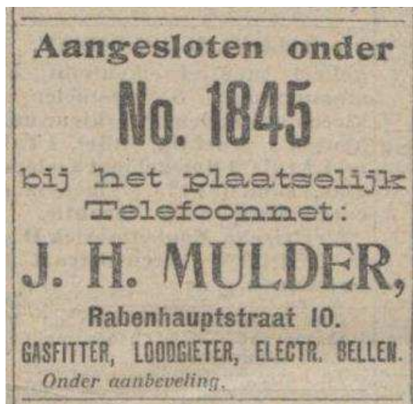
Advertentie in het Nieuwsblad van het Noorden van 13 februari 1913.