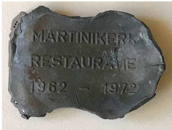
Een loodje gebruikt bij de restauratie van de Martinikerk te Groningen 1962-1972. De afmetingen zijn 8 x 6 cm.