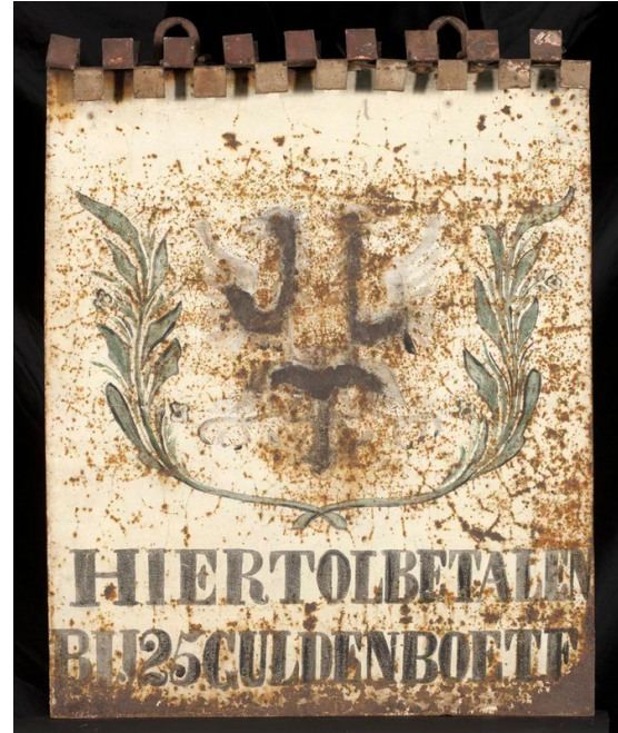
Het bord aan de paal bij de brug te Wedde.

De pachter moest wel altijd een borg achter zich hebben. Door de drost te Wedde werd deze tol jaarlijks aan den meestbiedende voor de Stad verhuurd. Bij de passage over deze brug waren de inwoners van Westerwolde en die van Roswinkel, vrij gesteld van de tolheffing.