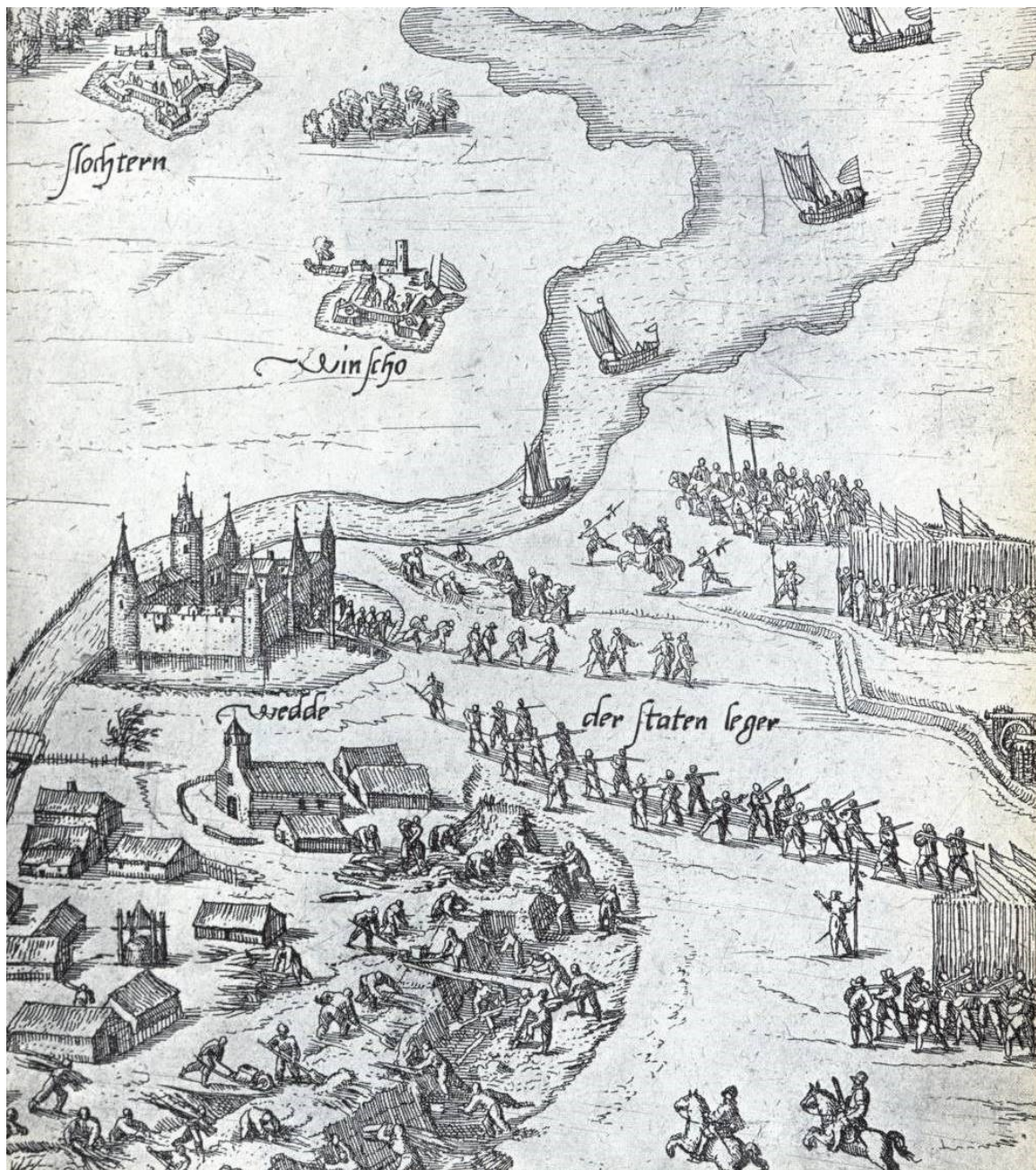
Deze gravure van Franz Hogenberg toont het beleg en de verjaging van de Spanjaarden uit het Huis te Wedde in het jaar 1593. Duidelijk is te zien dat de Westerwoldse Aa tot aan de brug bij de Burcht te Wedde bevaarbaar is.

Het Huis werd de woonstee van de Drost, de bestuursambtenaar die Westerwolde bestuurde.