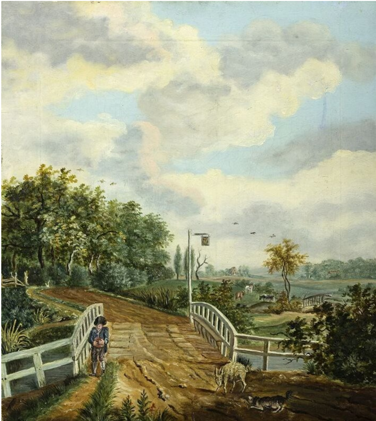
Brug te Wedde, schilderij van Assuerus Quaestius. Collectie Het Groninger Museum.

In hetzelfde document wordt tevens vermeld dat er “twie borden met des stadts wapen, tot anwijdinge van het alinge [ geheel ] der toll vervaardiget, om voor Campen arve nae Blijham een ende buiten Wedde omtrent de wegh nae Friescheloo ende Wedde van gelijk een geplaatst en opgericht te worden”.