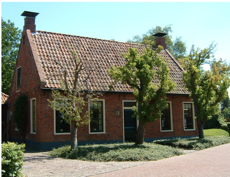
De foto toont de west- en noordgevel. opname 2003

RHC Groninger Archieven Toegangsnummer: 1, inventarisnummer: 572 1 Staten van Stad en Lande 4 Inventaris 4.03 Stukken betreffende het financiewezen 4.03.3 Bestekken Bestekboeken, 1666-1798 572. 1735 jan - 1736 mei