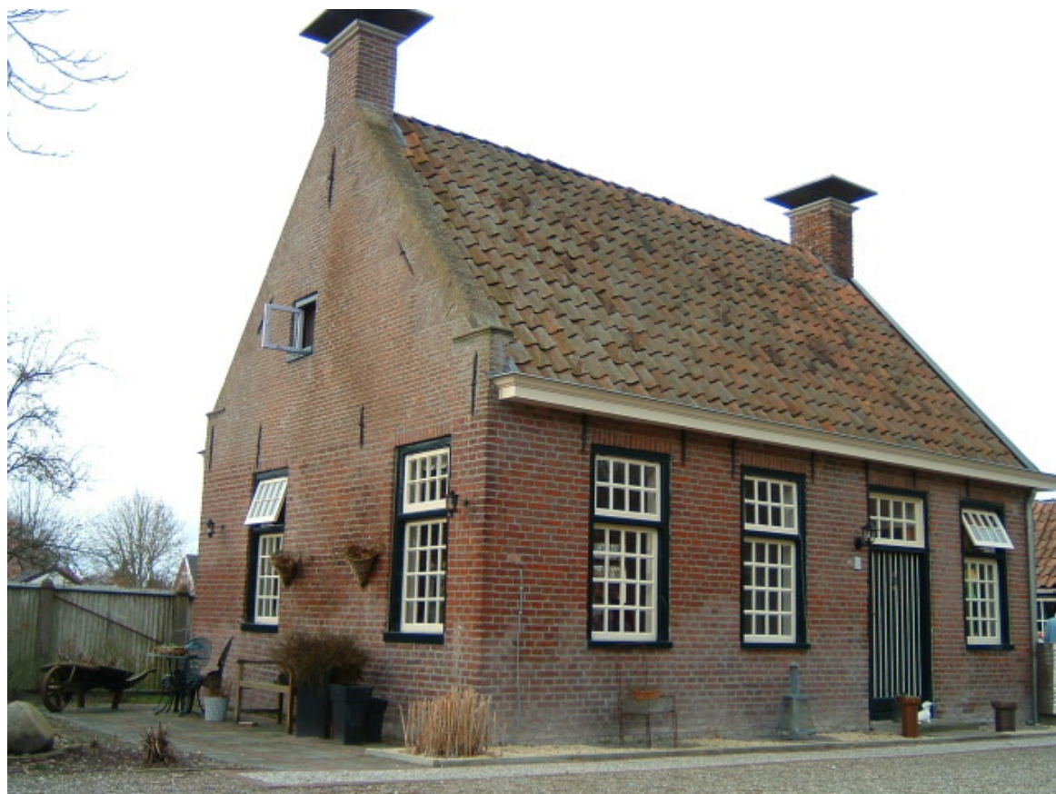
De voormalige sarrieshut aan de Pelmolenlaan 1 te Oostwold (O.) opname 3-1-2004

RHC Groninger Archieven te Groningen Toegangsnummer: 1, inventarisnummer: 623 1 Staten van Stad en Lande 4 Inventaris 4.03 Stukken betreffende het financiewezen 4.03.3 Bestekken Bestekboeken, 1666-1798 623. 1788 feb - 1788 dec