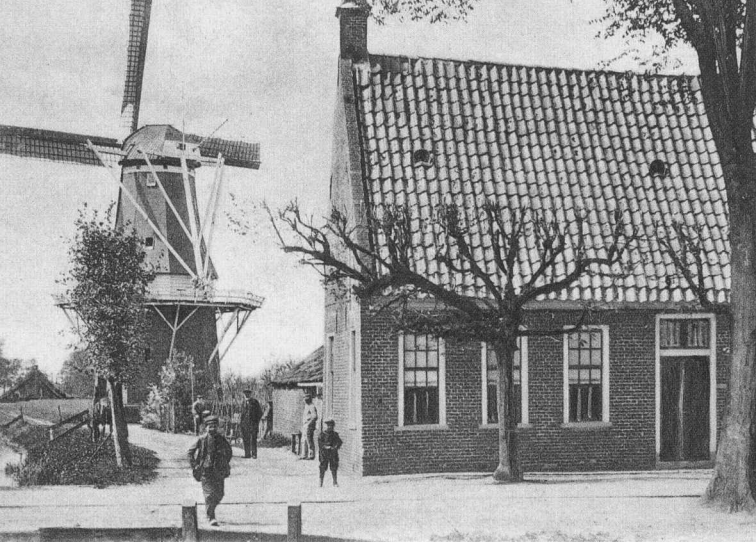
DE IN 1874 GEBOUWDE MOLEN VAN KOSTER MET HET MOLENAARSHUIS TE NIEUWE PEKELA; OPNAME CA. 1900.