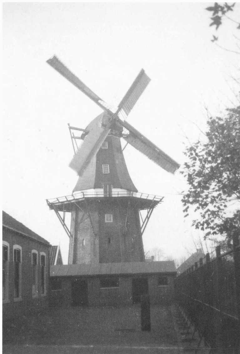
DE MOLEN ZELDENRUST TE OUDE PEKELA, GEFOTOGRAFEERD VANAF HET SCHOOLPLEIN; OPNAME 1933.