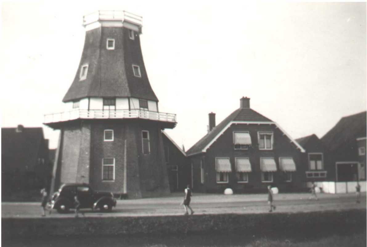
De molen aan het Boterdiep te Bedum in 1960.

De beide foto's komen uit de collectie van het Groninger molenarchief.