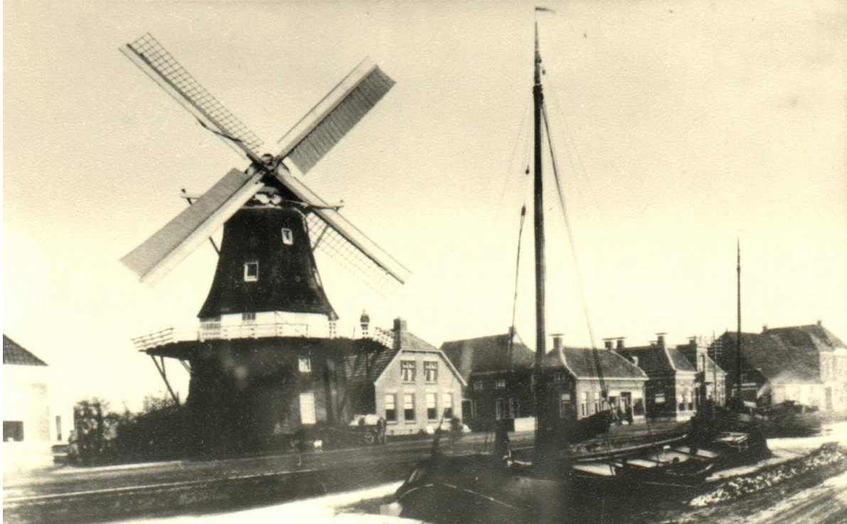
De molen aan het Boterdiep te Bedum in 1920.