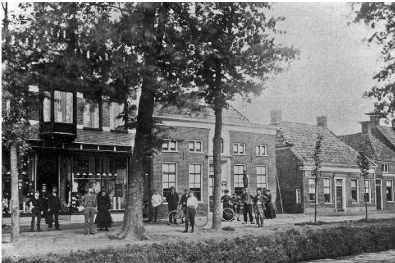
Afb. 4. Oude Pekela, links de winkel van Savenije, in het midden de molenaarswoning van Huizing, met ervoor de respectievelijke families.

op numero drie zijnde bezwet ten Noorden en grootendeels ten oosten tegen het land of de tuin van den Notaris Piccardt.’